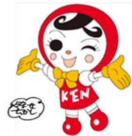
人権イメージキャラクター 人KENあゆみちゃん

宮崎県人権啓発推進協議会及び宮崎県は、宮崎地方法務局及び宮崎県人権啓発活動ネットワーク協議会協力のもと、宮崎県内全市町村において、人権啓発パネル展示等を行ういきいきふれあいりレー啓発展を開催します。同和問題をはじめとする人権問題に対する理解と認識をより一層深めてもらう機会となります。お気軽にご来場ください。